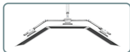
Triple Bow Kit