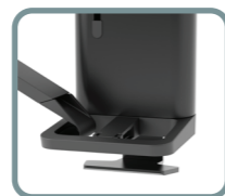
Single bildskärm Kit