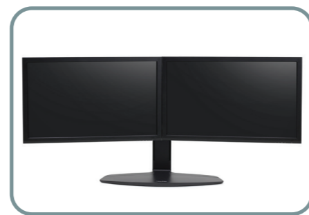
Neo-Flex Lyftstativ för dubbel LCD