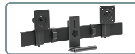
Dual Conversion Kit