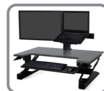
LCD & Laptop Kit