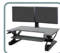
Dual Monitor Kit