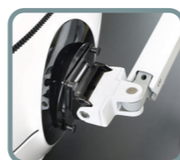
Förstärkt vinklignbart fäste