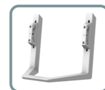
Dual Direct Handle Kit