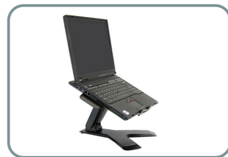
Neo-Flex Lyftstativ för notebook

Väggmonteringslösningar är perfekta i exempelvis receptioner, mötesrum eller för andra utrymmen i moderna företagskontor..