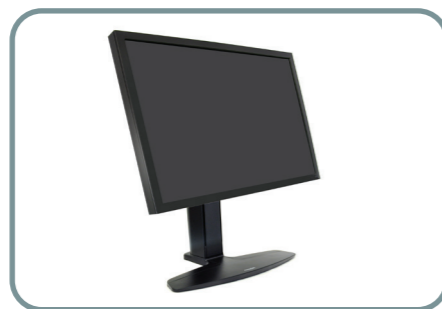
Neo-Flex Lyftstativ för bredbildsskärm