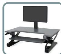
Single Monitor Kit