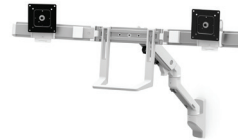
Braccio per doppio monitor a parete HX