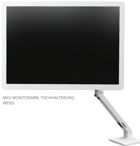
MXV MONITORARM, TISCHHALTERUNG WEISS