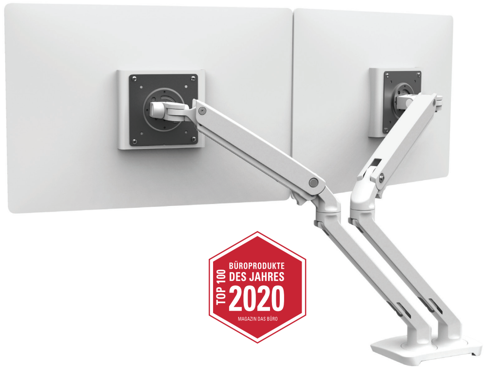
MXV DUAL MONITORARM

SCHLANKES PROFIL UND MODERNES DESIGN: LEICHTGEWICHTIGER ARM VERBESSERT IHREN ARBEITSPLATZ MIT FUNKTIONALITÄT UND STIL