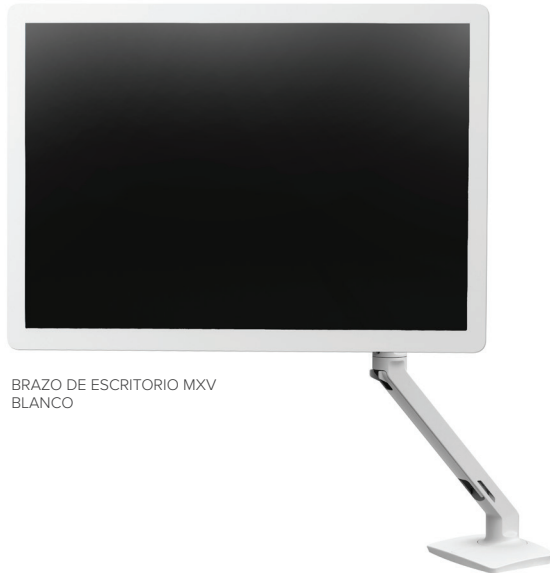
BRAZO DE ESCRITORIO MXV BLANCO