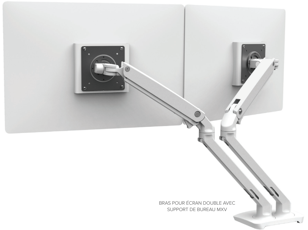
BRAS POUR ÉCRAN DOUBLE AVEC SUPPORT DE BUREAU MXV

MODÈLE ÉLÉGANT ET MODERNE : CE BRAS PERMET D'OPTIMISER VOTRE POSTE DE TRAVAIL, TOUT EN OFFRANT DES PROPRIÉTÉS ESTHÉTIQUES ET FONCTIONNELLES