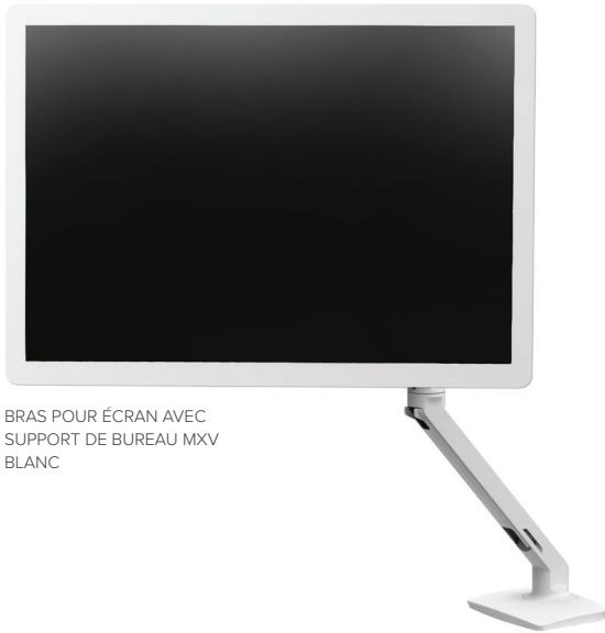
BRAS POUR ÉCRAN AVEC SUPPORT DE BUREAU MXV BLANC

PLUSIEURS OPTIONS DE FIXATIONS DE BUREAU SONT DISPONIBLES