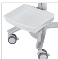
PLATEAU AVANT SV