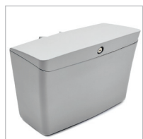
BAC DE RANGEMENT SV