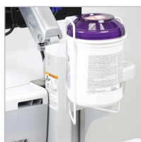
DISTRIBUTEUR DE LINGETTES SANITAIRES SV