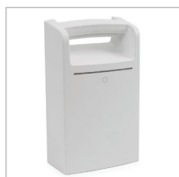
SYSTÈME D'ALIMENTATION LIFEKINNEX™

Accessoires supplémentaires disponibles sur healthcare.ergotron.com .