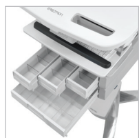
PLUSIEURS CONFIGURATIONS DE TIROIRS