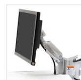
BRAS POUR ÉCRAN