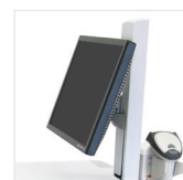
PIVOT POUR ÉCRAN