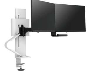
双显壁挂 (带面板夹)