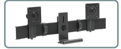
双转换套件 47-110-224 (哑光黑)