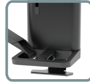
纤薄桌夹 98-490-224 (哑光黑)