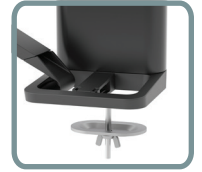
穿孔配件 98-492-009 (哑光黑)