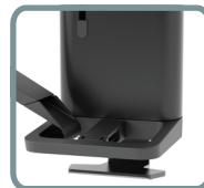
PROFILO SOTTILE 98-490-224 (NERO OPACO)