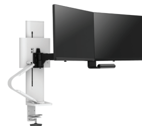
Doppio con morsetto a pannello