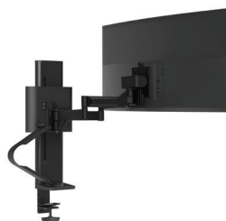
Singolo con morsetto a pannello