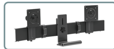
DOPPIO 47-110-224 (NERO OPACO)