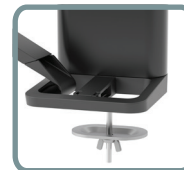
CON FORO PASSANTE 98-492-009 (NERO OPACO)